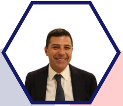
Ugo Trama , DIRIGENTE DIREZIONE GENERALE PER LA TUTELA DELLA SALUTE E IL COORDINAMENTO DEL SISTEMA SANITARIO REGIONALE DELLA REGIONE CAMPANIA