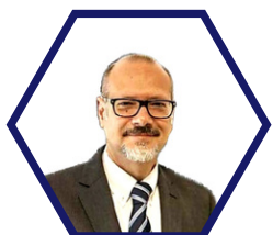
Vincenzo Loia , MAGNIFICO RETTORE UNIVERSITÀ DI SALERNO